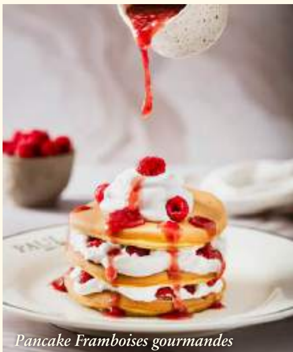
Pancake Framboises gourmandes

Chez nous, l'authenticité et la qualité sont au cœur de nos créations. Nos croissants et brioches sont 100% pur beurre, garantissant une texture fondante et un goût inimitable.