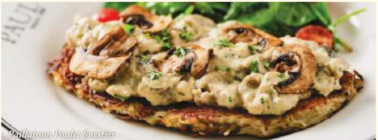
Paillasson Poulet forestier