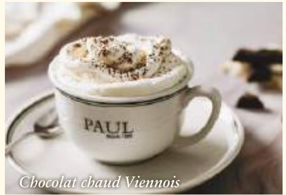
Chocolat chaud Viennois