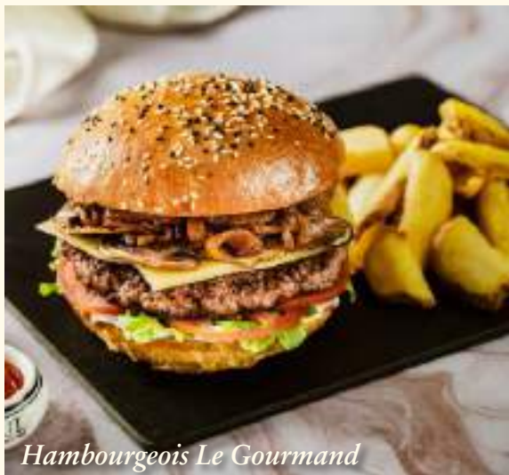
Hambourgeois Le Gourmand

Servis avec frites ou chips spéciales au choix