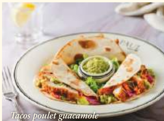
Tacos poulet guacamole