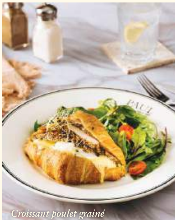
Croissant poulet grainé