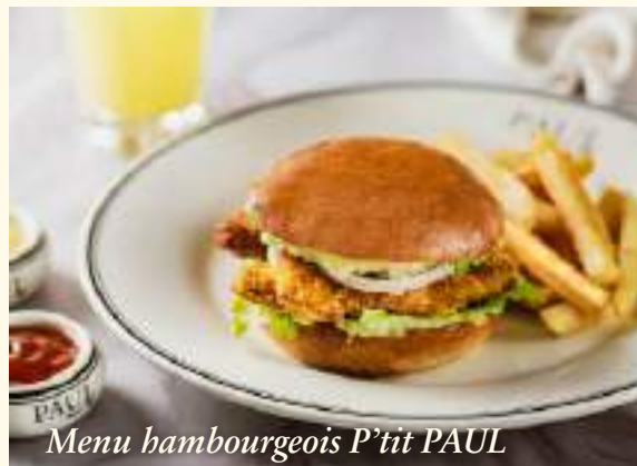
Menu hambourgeois P'tit PAUL

Gourmand, cheese hambourgeois ou poulet pané croustillant